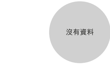
校長及教學人員幼兒教學年資 (2020年3月資料)