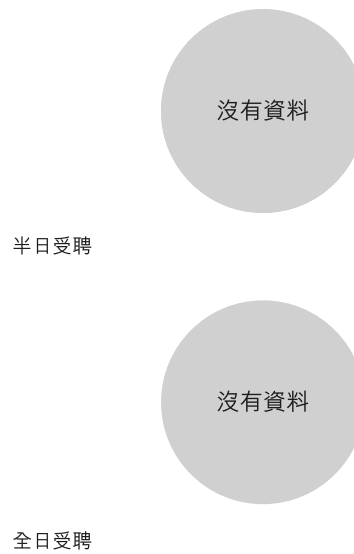
校長及教學人員幼兒教學年資 (2020年3月資料)